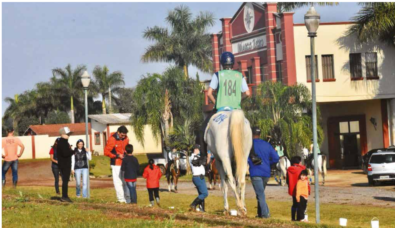
IV Etapa COPA DO BRASIL - "CBH 2020" - Rach Stud International Cup (Araçoiaba da Serra- SP) 18 a 20 de setembro 2020 - Velocidade Livre: CEI/CEN - CEIYR/CENYR de 1*, 2* e CEN 80 km