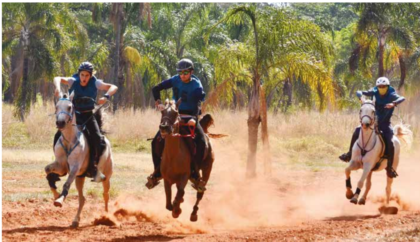
V Etapa COPA DO BRASIL - "CBH 2020" - CCB (Brasília-DF) 09 a 10 de Outubro 2020 - Velocidade Livre: CEI/CEN - CEIYR/CENYR de 1*, 2*, CEN 80 km e CEI/CEN 3*